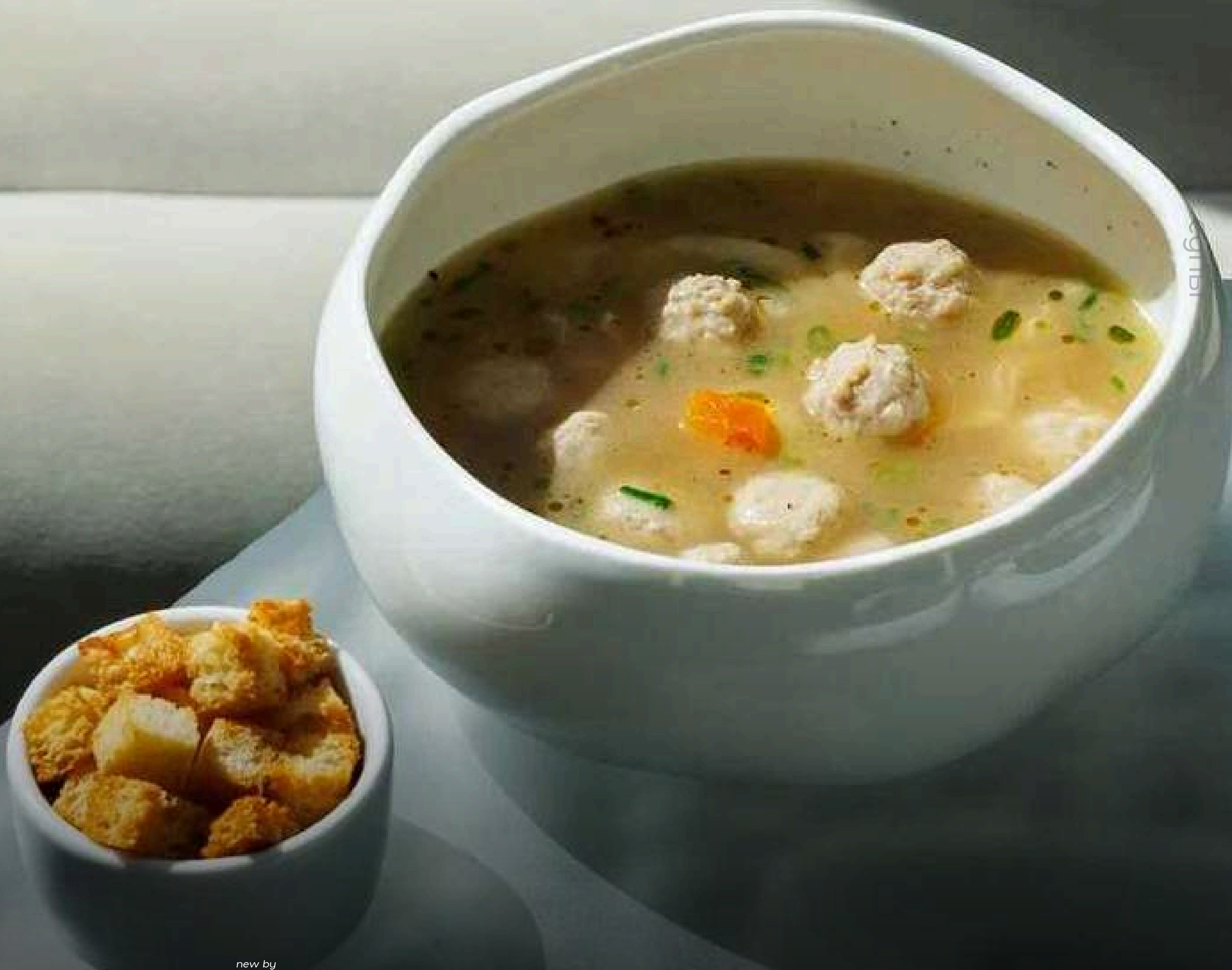
Луковый суп new by Mirko Zago 320 г 590 куриный с фрикадельками