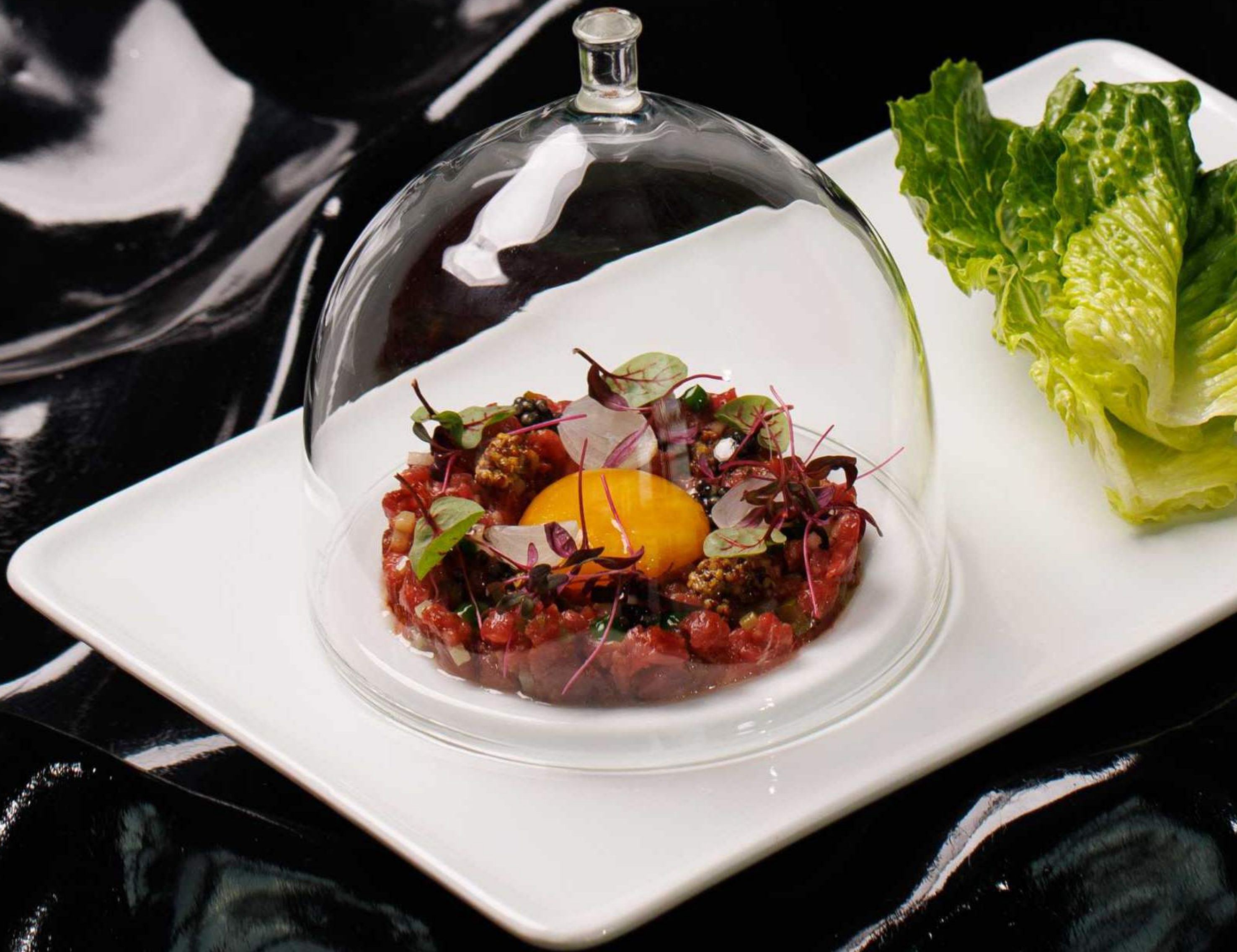
Подкопчённый тартар из говядины 230 г 1780 Чёрная икра, зёрна горчицы, жемчужный лук, томаты вяленые, соус зелёный айоли