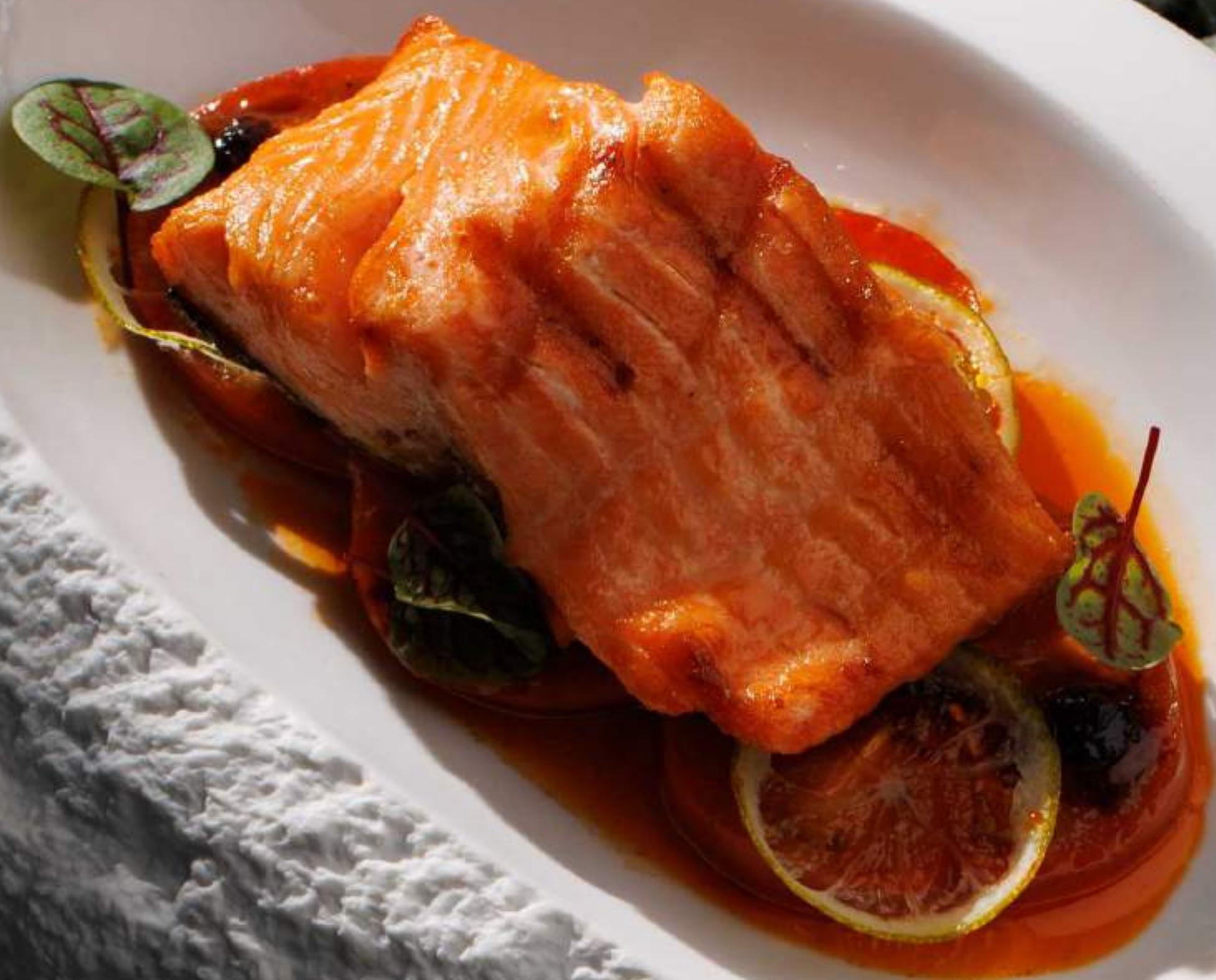
Лосось на углях 260 г 1680 с карпаччо из обожжённых томатов Тапенада из маслин и анчоусов