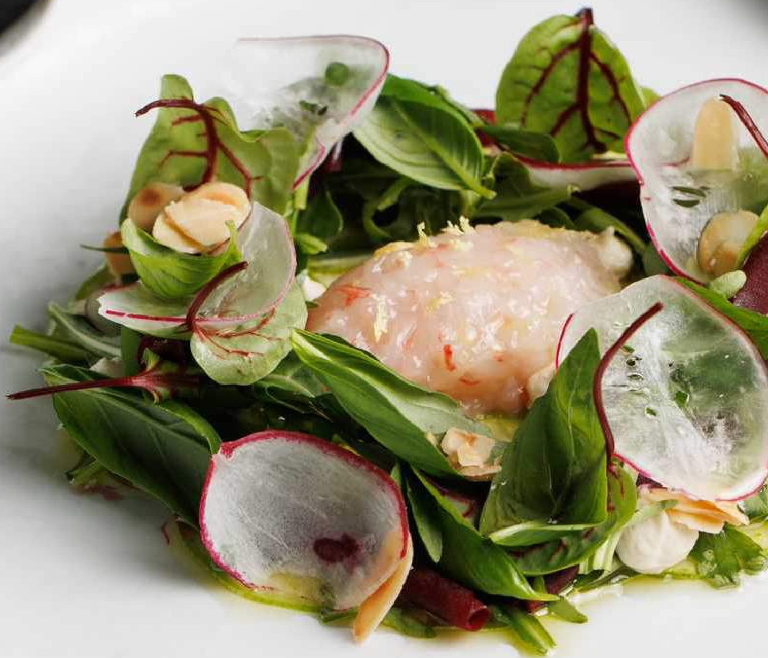
Тартар из креветки new 130 г 990 Ама Эби Песто из изумрудной фисташки, карпаччо из цукини, крем из кедрового ореха