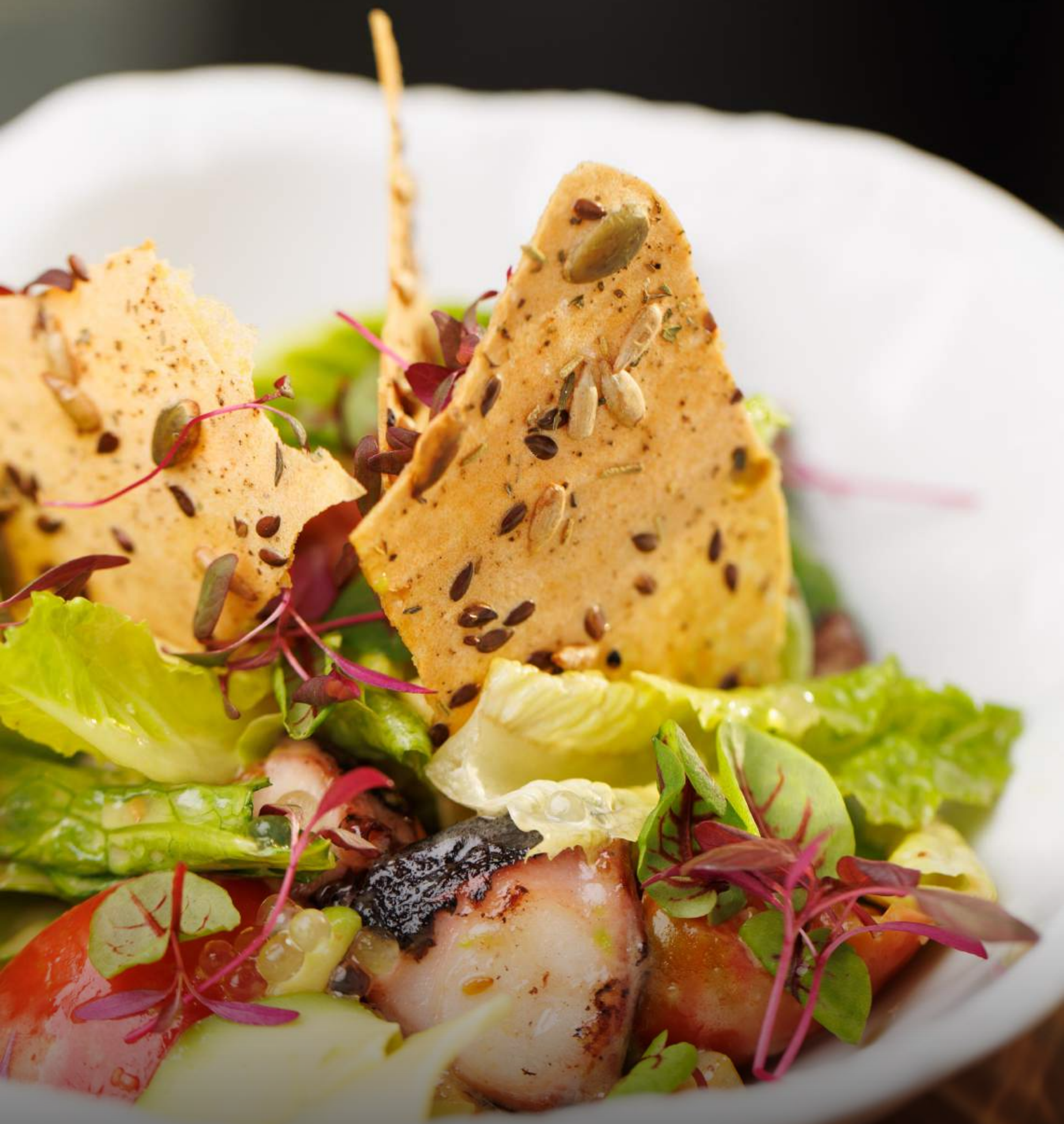
Марокканский осьминог с артишоками 220 г 1480 Сладкие томаты, авокадо, оливки, бальзамическая икра, микс салатов, злаковые чипсы