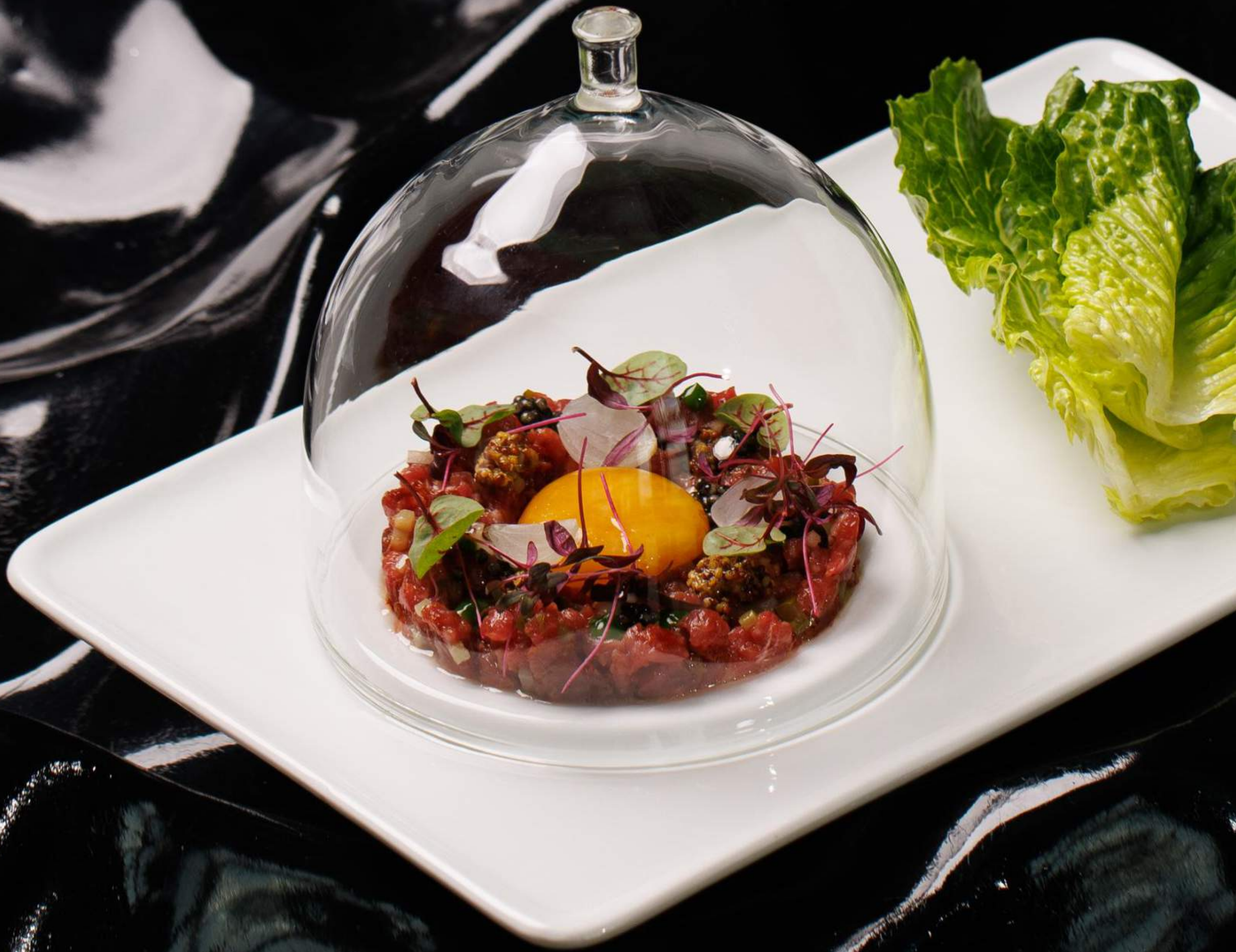
Подкопчённый тартар из говядины 230 г 1680 Чёрная икра, зёрна горчицы, жемчужный лук, томаты вяленые, соус зелёный айоли