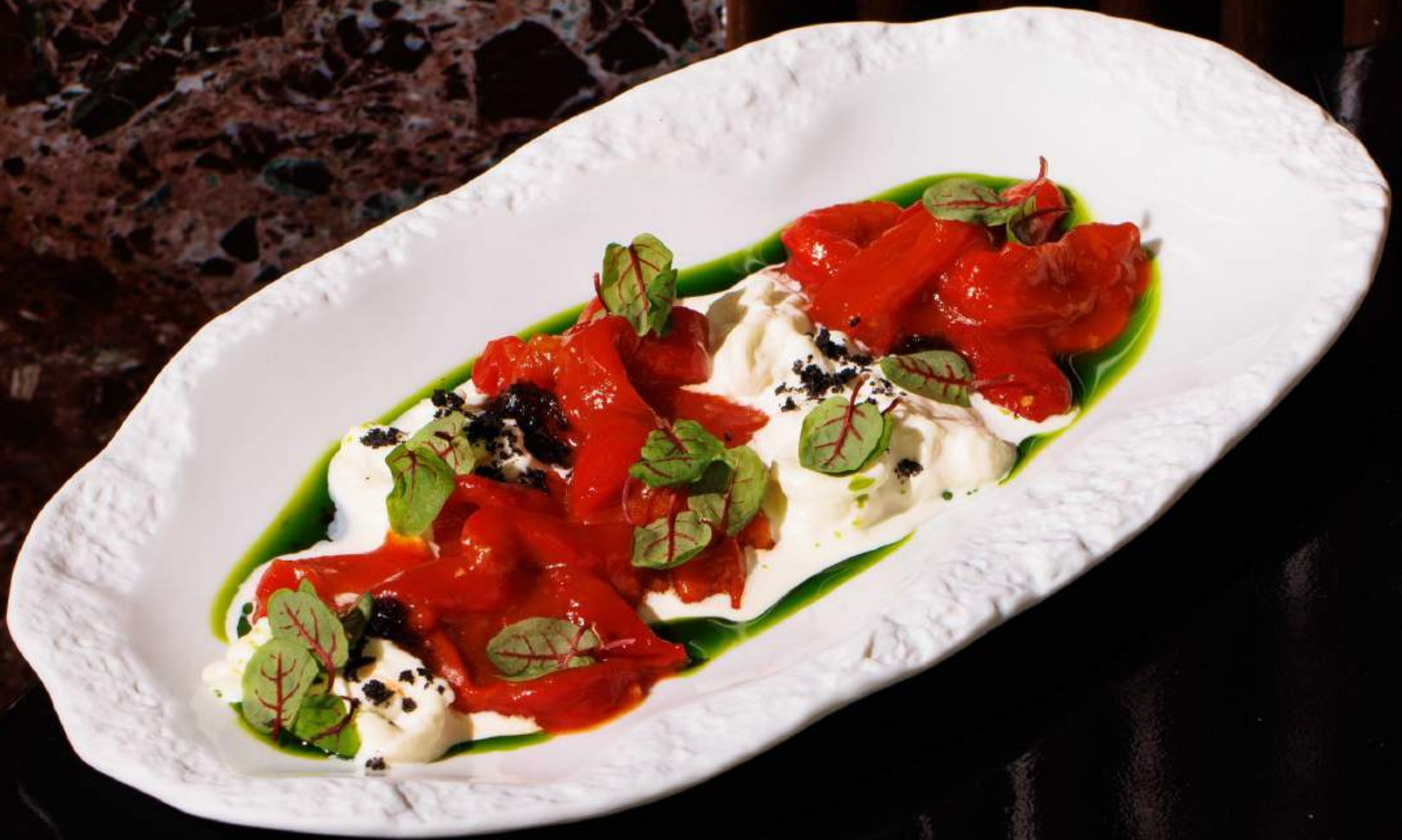
Запечённые перцы со страчателлой и тапенадой из маслин и анчоусов