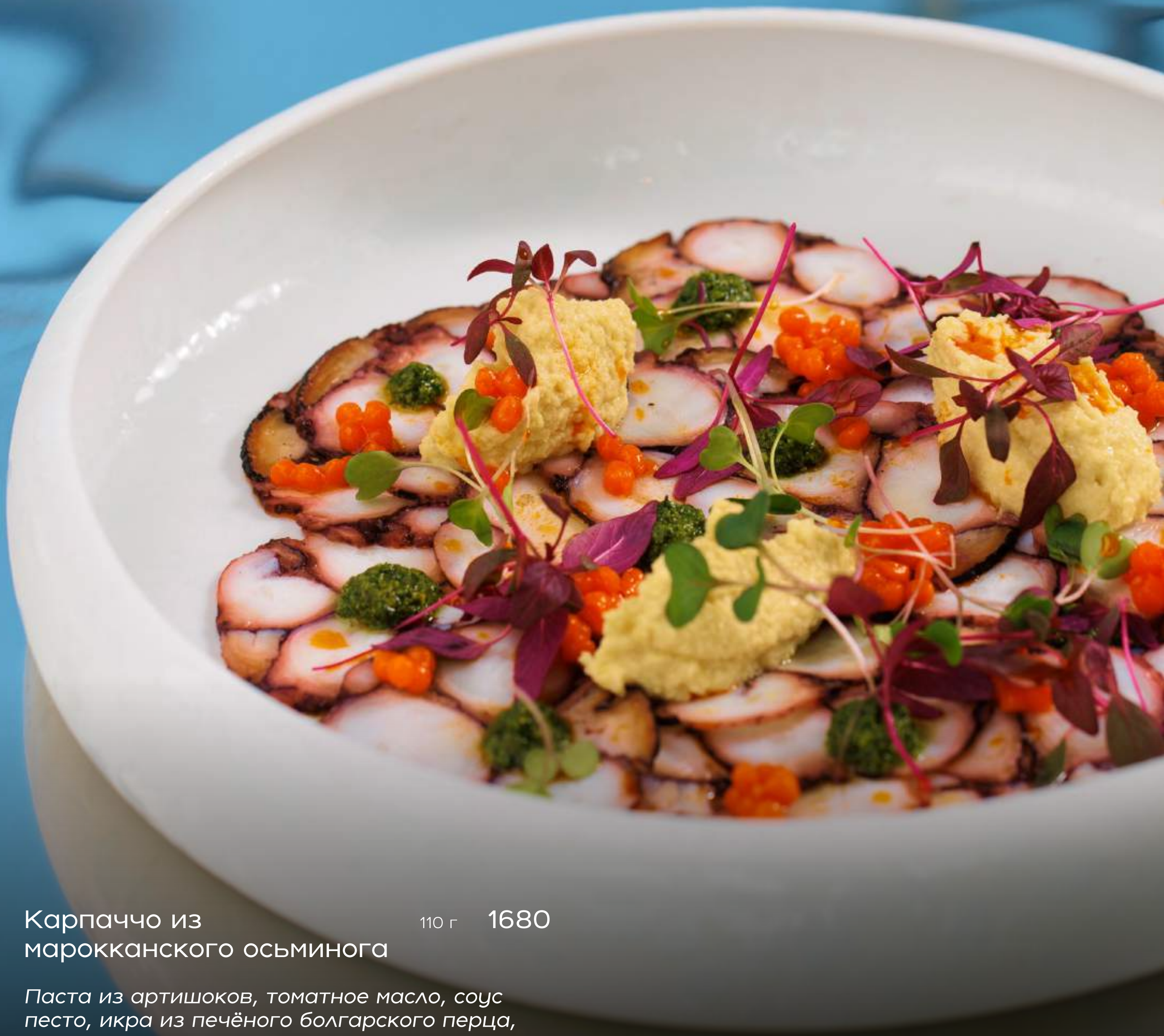
Карпаччо из марокканского осьминога